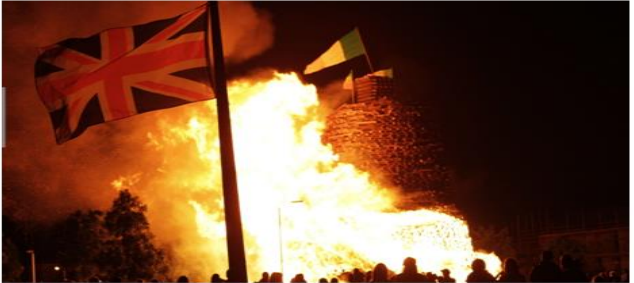
Protestantes observam grande fogueira em West Belfast, na Irlanda do Norte. Os irlandeses celebram no dia 12 de julho a Revolução Gloriosa e a vitória do rei protestante Guilherme sobre o rei católico Jaime na Batalha do Boyne, de 1690 (12/07/2012)